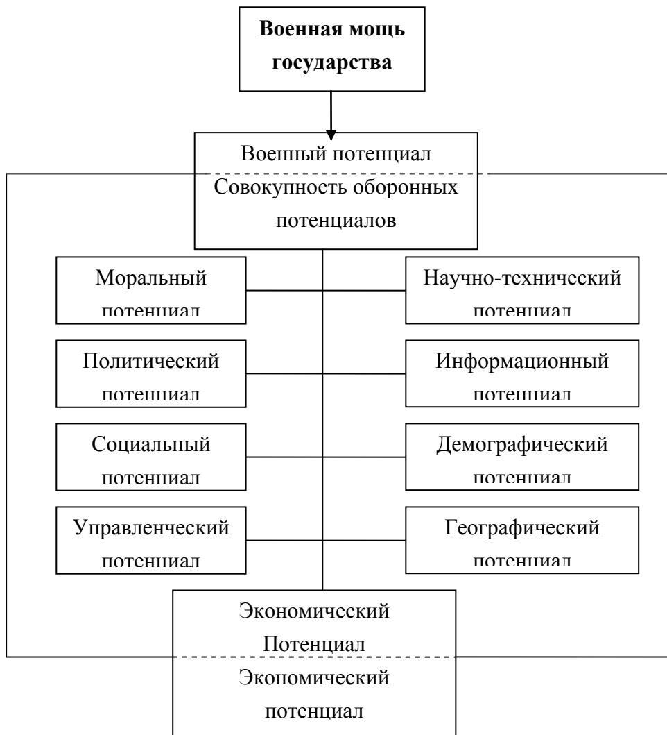
Рис. 1. Структура военной мощи государства