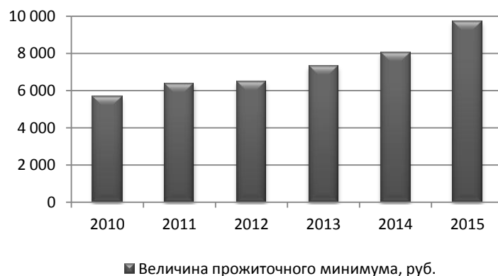
Рис. 2. Величина прожиточного минимума в России за 2010-2015 гг.

С 2010 года наблюдается сначала снижение численности населения с уровнем среднедушевых располагаемых ресурсов ниже бюджета прожиточного минимума с 12,5% до 10,7% в 2012 г., а затем рост до 13,3% в 2015 г. Этот рост свидетельствует о снижении масштабов социальной поддержки населения и увеличении неравенства в обществе (таблица 2).