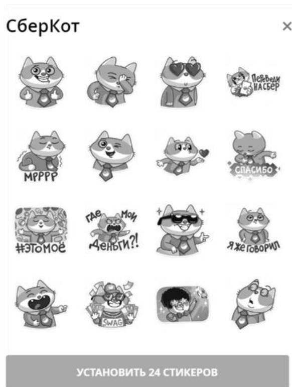
Рис. 3. Стикеры Telegram от Сбербанка России «СберКот»

По состоянию на 10 января 2018 года подтвердились планы по созданию Павлом Дуровым своей криптовалюты «Gram» [5]. Планируется полноценная система микроплатежей, доступная как пользователям приложения, так и другим сервисам. Это откроет новые возможности для бизнеса в Telegram.